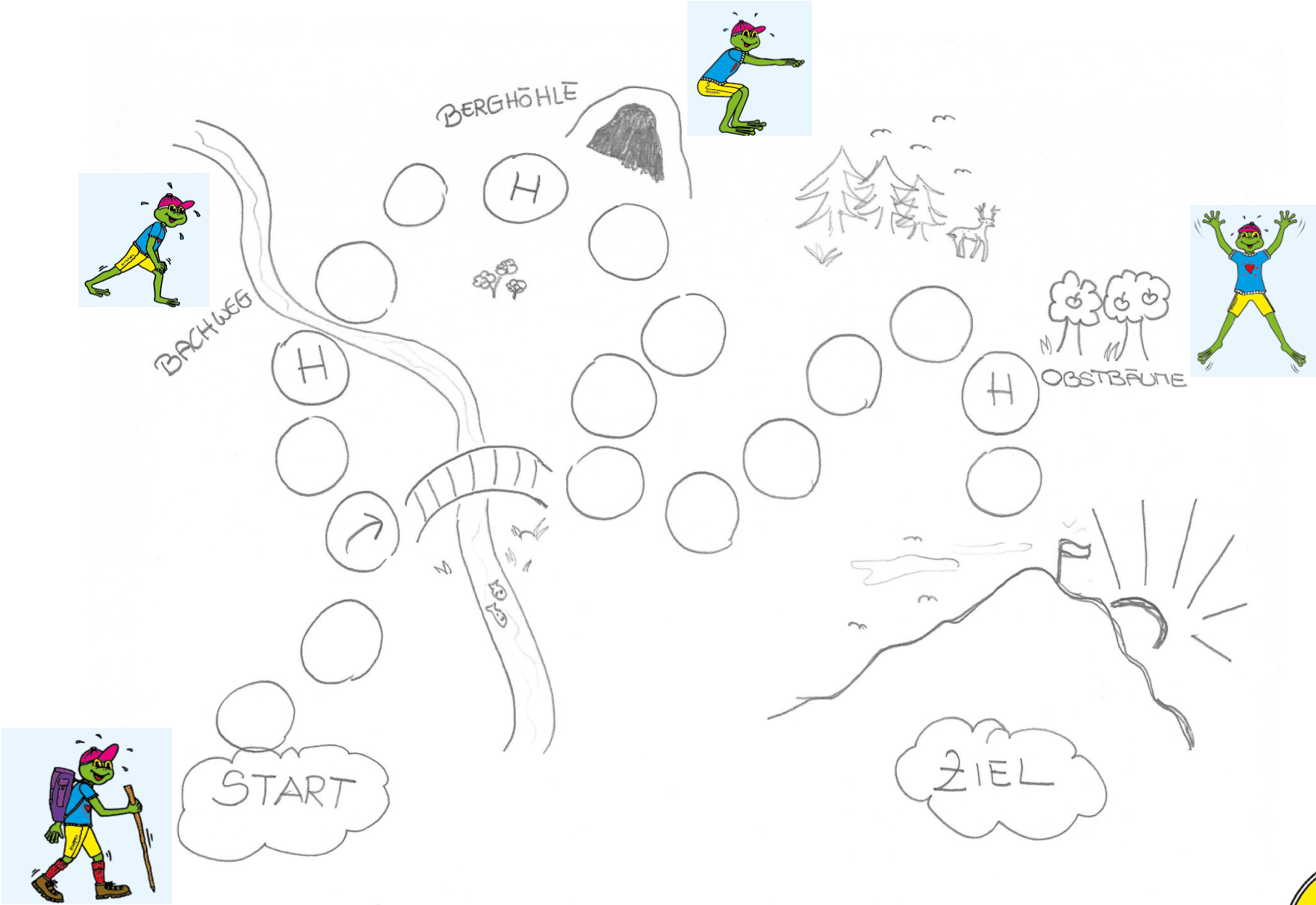
Hopsi Hopper Wanderspiel